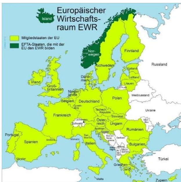
Ergänzte Grafik

Es soll einen Überblick über das deutsche Besteuerungsverfahren bei der Versicherungs- und der Feuerschutzsteuer geben.